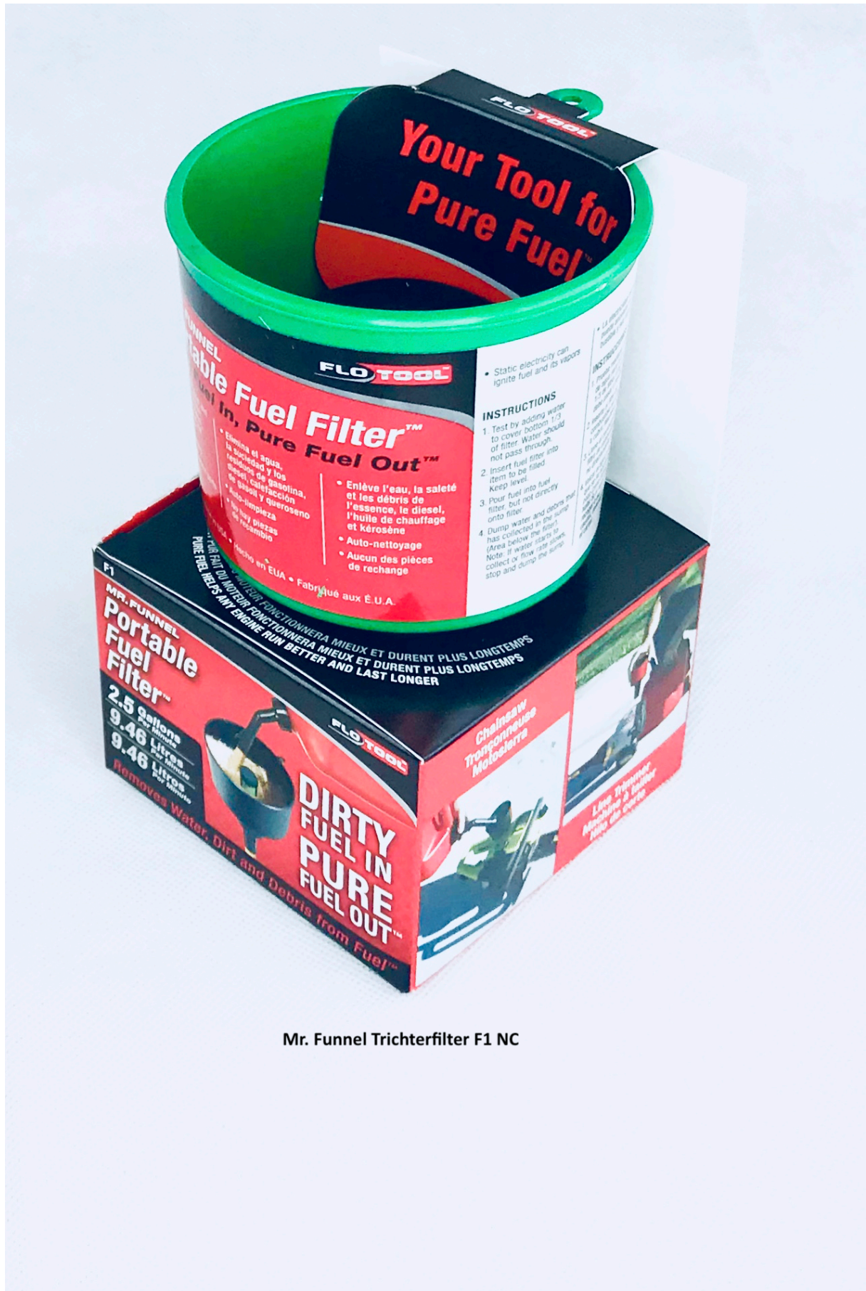
Mr. Funnel Trichterfilter F1 NC