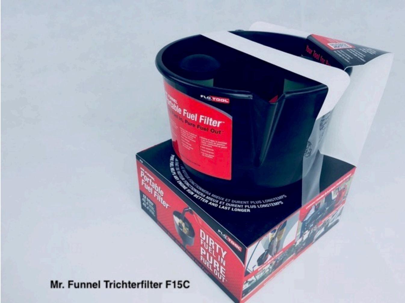
Mr. Funnel Trichterfilter F15C